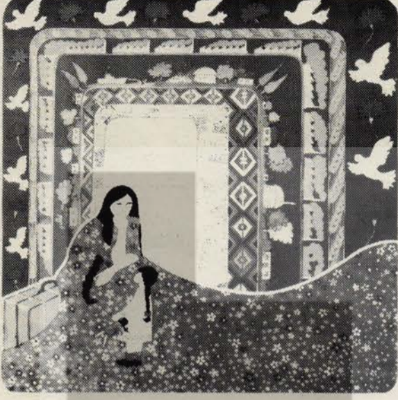
(6-8 Haziran - June 1985 Amsterdam)

EUROPEAN CONFERENCE OF TURKISH WOMAN MIGRANTS