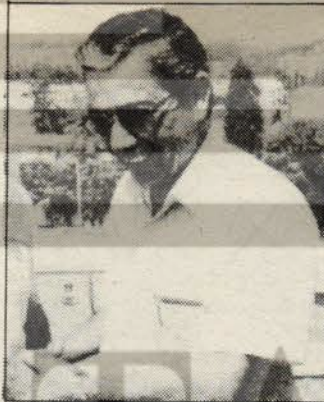
CTP Genel Başkanı Özker Özgür