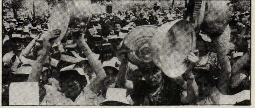
Gerçek gazetesi muhabirlerinin izlenimlerinden