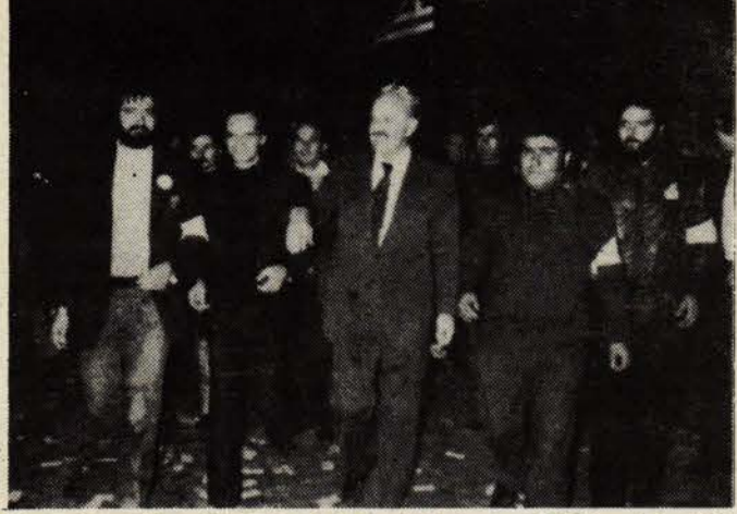
Yunanistan Komünist Partisi Genel Sekreteri Harilaos Florakis seçim kampanyası sırasında.