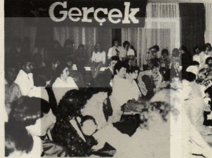
Gerçek Münih Komitesi'nin daha önce Münih'te düzenlediği bir toplantıdan görünüm.