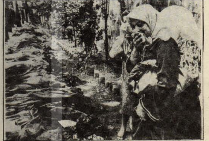
Filistin halkı dayanılmaz acılara daha ne kadar katlanacak?..

Herşeye rağmen Ortadoğu'da ve Lübnan'da barış sürecini ve adil çözüm imkanlarını ortadan kaldıracak olan İsrail'in ve ABD'nin insaf ölçüleri olmayacak, ilerici güçlerin ancak uzun erimde başarıya ulaşacağı belli olan müdahale sonucu tayin edecektir.