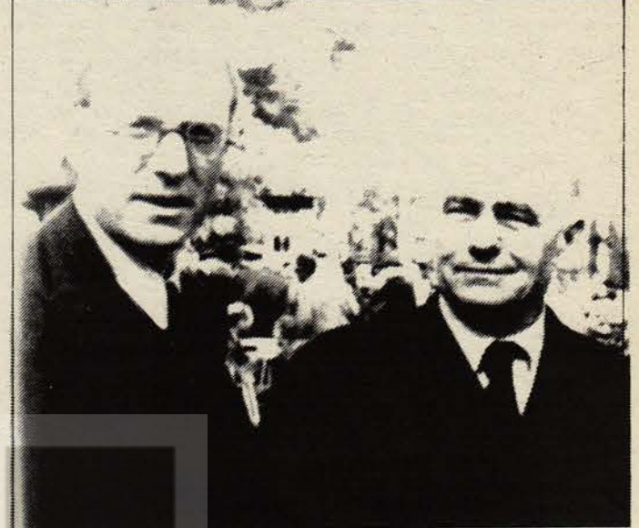
Enternasyonal liderlerinden Wilhelm Pieck, Otto Grotewohl ile.

VII. Kongre komünistlerin önüne şu görevi koydu: "Faşizm işçileri kendi legal örgütlerinden yoksun bırakmıştır. Onları faşist örgütlere girmeye zorlamıştır; yığınlar oralaradadır. Kimisi zorla kimisi ise kendi istekleriyle bu örgütlere katılmışlardır. Faşizmin bu kitle örgütleri bizim kitlelerle ilişki kuracağımız legal veya yarı-legal eylem alanlarımız olabilir ve olmalıdır da. Bu örgütler kitlelerin günlük çıkarlarını savunabilmemiz için bizim legal veya yarı-legal çıkış noktamız olmalıdır. Komünistler bu imkânlardan uzak duracaklarına bu örgütlerde yönetim kademelerini ele geçirmek için çalışmalıdırlar... Ve böyle bir çalışmanın devrimci işçinin kendisine duyduğu saygıya ve şerefine uygun düşmeyeceği şeklindeki önyargıdan tümüyle kurtulmalıdırlar."