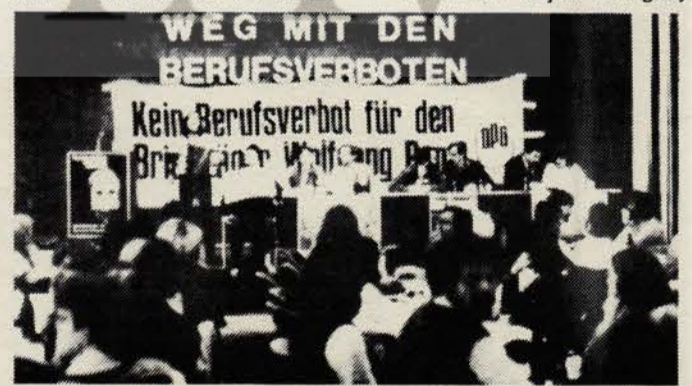
IG Metal Sendikası'nın dava sanıklarıyla dayanışma toplantısından bir görünüş.