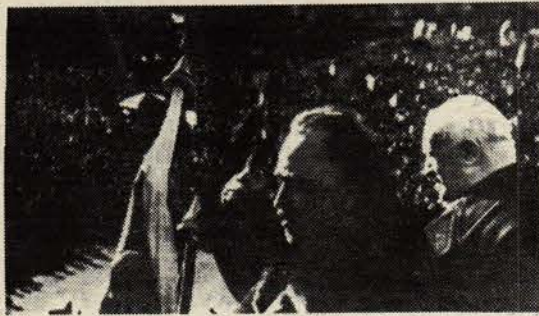
Dimitrof Kalarof ile

III. Enternasyonal'in VII. Kongresi'nde yönetime seçilenler: Prezidyum üyeleri: Cachin, Dimitrof, Ercoli, Florin, Foster, Gottwald, Kolarof, Kuusinen, Lenski, Manuilski, Marty, Moskvın, Okana, Pieck, Pollitt, Stalin, Thorez, Wan Min Sekreterlik: Dimitrof (Genel Sekreter), Ercoli, Manuilski, Pieck, Kuusinen, Marty, Gottwald