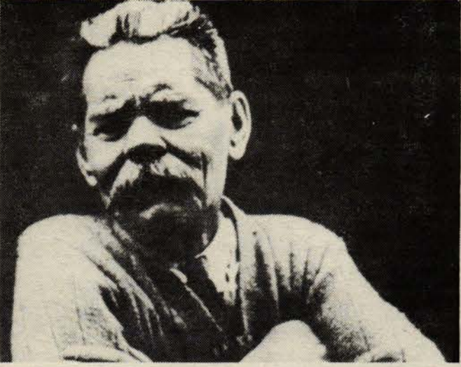
Yunanlı besteci Mikis Teodorakis'le bir söyleşi