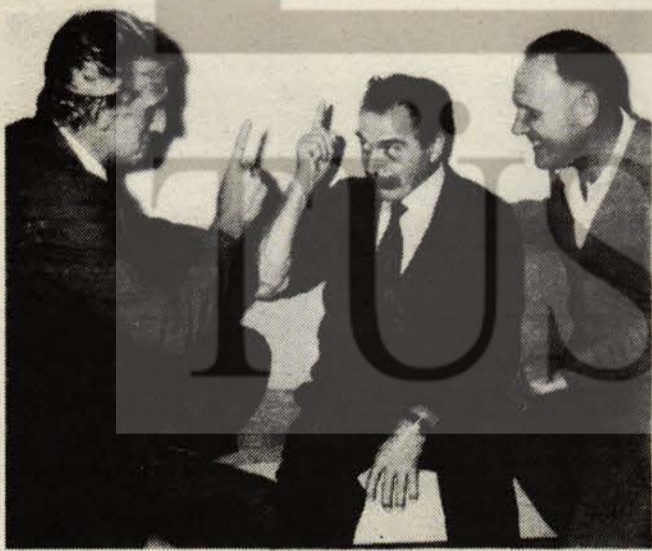
Mengele ve hamileri Wolfgang Gerharrd, Wolfram Bossert.

Bunlar öyle deneylerdir ki, 700 bine yakın tutuklu ve savaş tutsağının ölümüyle sonuçlanmıştır. Mengele on binlerce insanı kobay olarak kullanmış, öldürdüğü insanların iç organlarını ve deneylerinin sonuçlarını Alman tıp kuruluşlarına muntazaman göndermiş, analarının kollarında koparıp aldığı yavruların, onların gözü önünde canlı canlı ateşe atmış, faşizmin yenilgisinden sonra bütün insanlığın, hesap sormak için can attığı