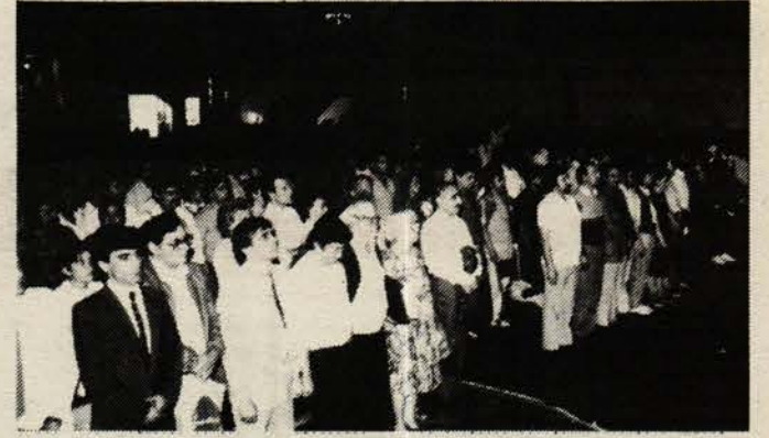
Sol Birlik'in Paris toplantısından bir görünüm

Polise yeni yetkiler veren yasa yürürlüğe girdi